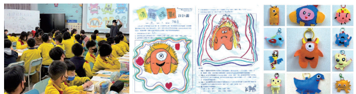
引導繪製情緒怪獸表情包設計 -----實作情緒怪獸表情包繪圖-----

在全體教師努力規畫下，透過小小解說員的解說導覽、製作簡報並入班（全校）宣導、展品仿作與創作、成果發表，不僅激發出學生的獨特創意，更豐富全校親師生的藝文涵養，活動內容活潑生動有趣。