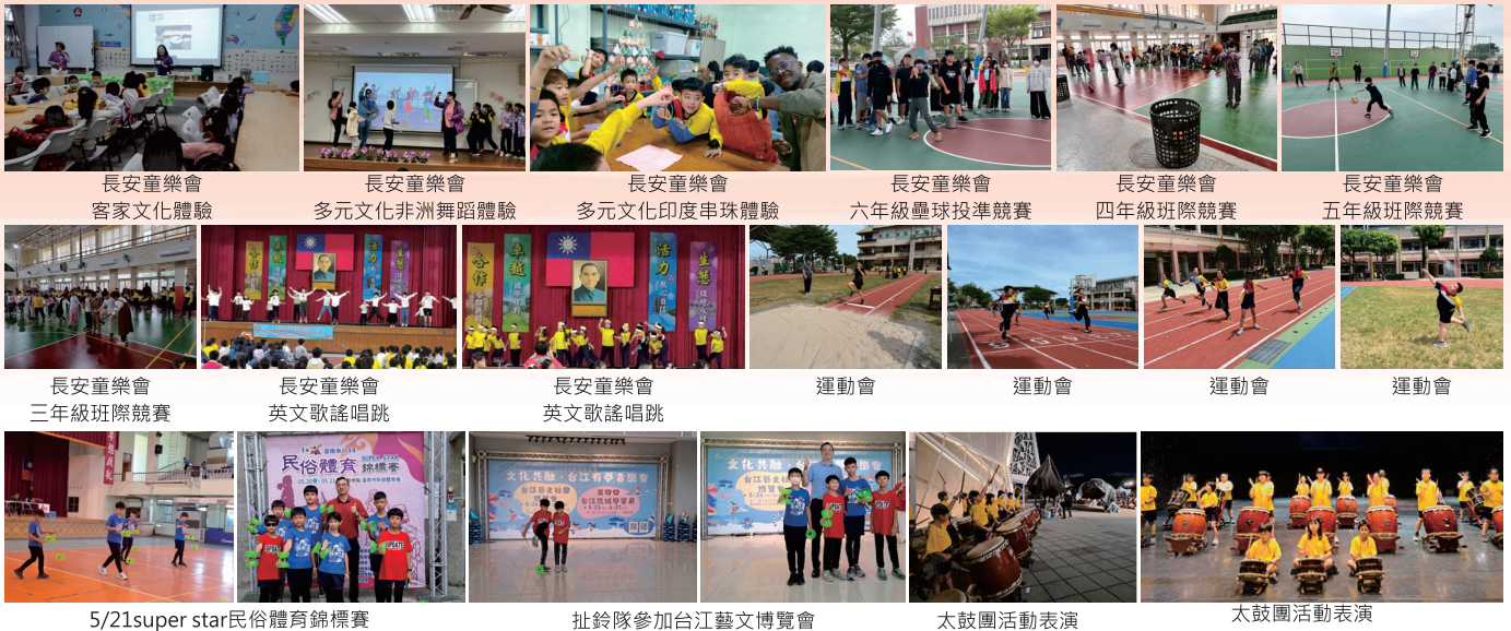
長安童樂會 客家文化體驗