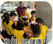
世界口腔健康日快閃闖關活動