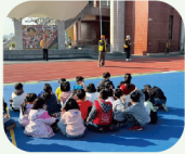
全校防災演練說明