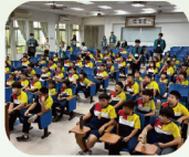
認真聽講法律小常識