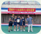
春季中小學田徑賽