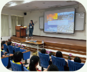
說明淨零排碳重要性