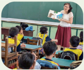
藉由說故事了解牙齒重要