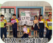
世界口腔健康日快閃活動