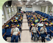
曾文水庫節水宣導